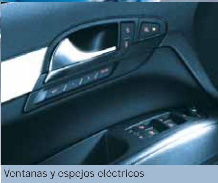
Ventanas y espejos eléctricos