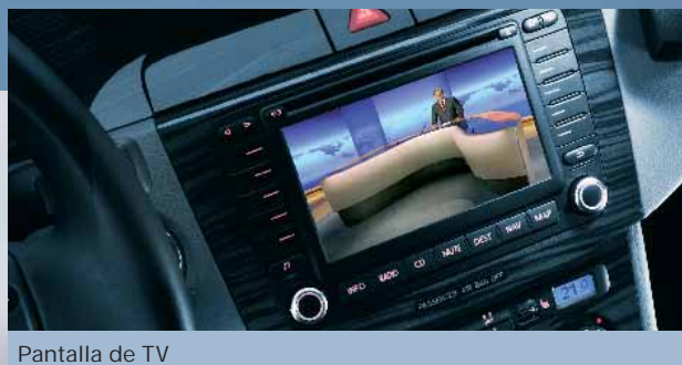
Pantalla de TV