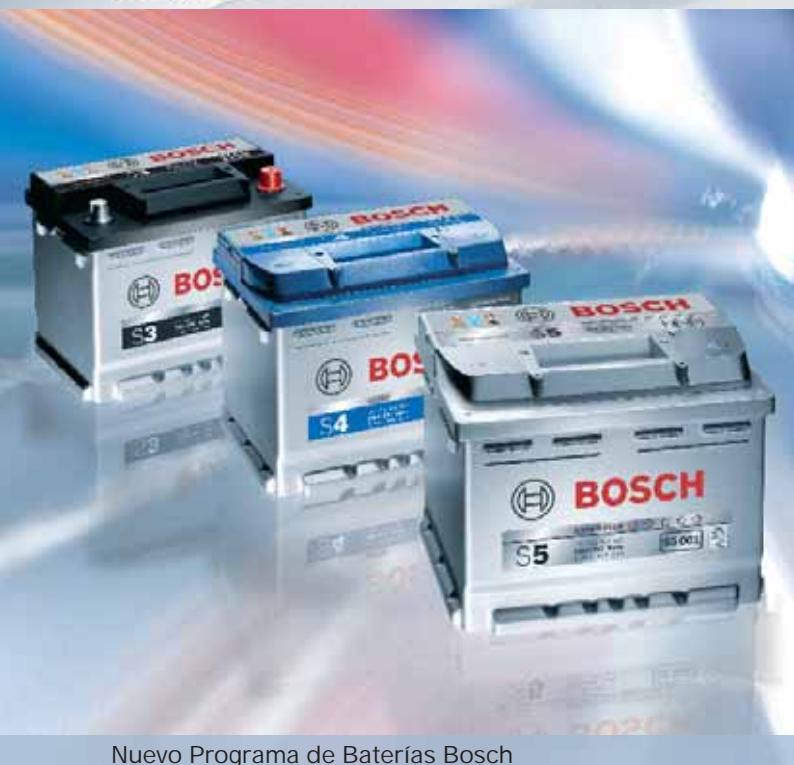
Nuevo Programa de Baterías Bosch