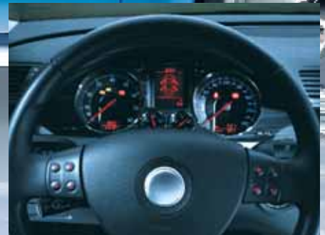
Electrónica del salpicadero y el volante