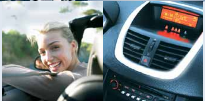
Radio y consola de instrumentos