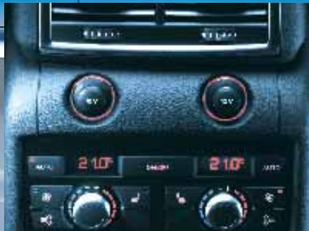
Calefacción eléctrica en asientos traseros