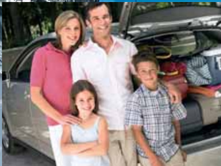
Potencia de arranque en todo momento