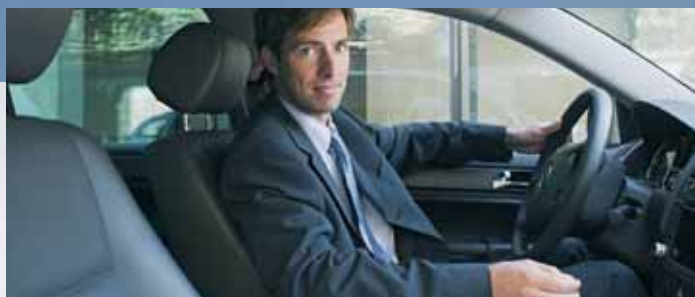
Seguridad máxima para clientes exigentes

Mayor capacidad de arranque en frío, mayor capacidad de reserva y más seguridad. En los automóviles de lujo, contar con un suministro fiable de electricidad para las prestaciones extra, es un factor determinante al elegir una batería. La Batería Bosch S5 , está especialmente indicada para los vehículos nuevos de clase alta, ya que cumple todas las sofisticadas exigencias de los fabricantes de primeros equipos... e incluso las supera. Su Tecnología Silver y su capacidad de reserva, incrementa notablemente la vida útil de las baterías.