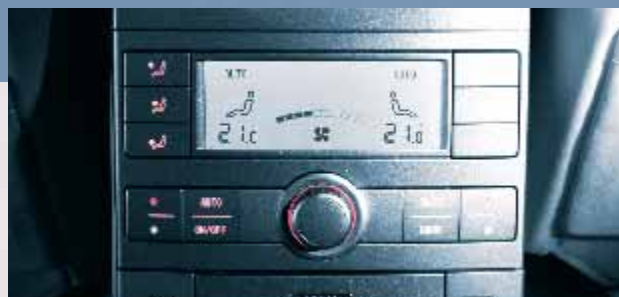
Configuración en pantalla para calefacción de asientos